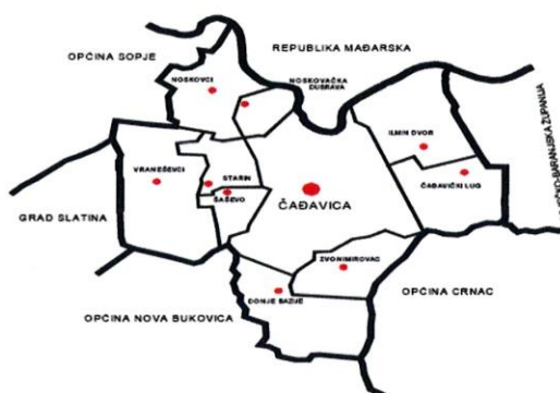
Općina Čađavica – karta

Općina Čađavica usvojila je 'Strateški program razvoja 2015-2020 godine' koji predstavlja temeljni, krovni dokument za participativni i održivi razvoj općine. Strategija identificira glavne smjerove dugoročnog razvoja općine, nastoji osigurati strateško fokusiranje i usmjeravanje na potencijale Općine Čađavica koji su razvojno najperspektivniji kako bi se svi lokalni resursi iskoristili na najučinkovitiji i održiv način.